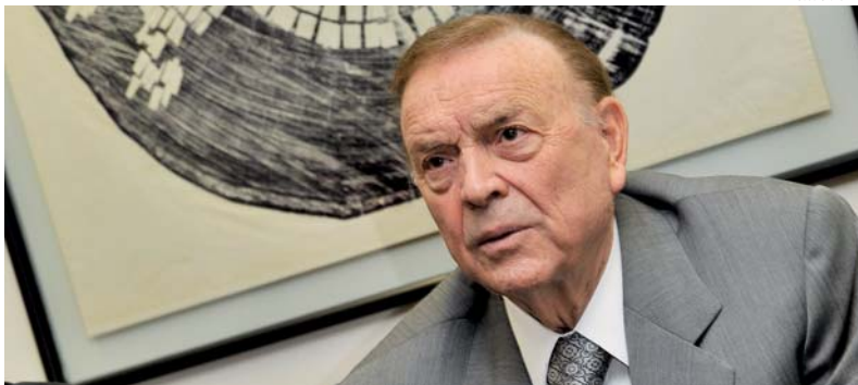
José Cruz / ABR

Rússia entregou à Fifa relatório sobre cidades que desejam receber partidas da Copa de 2018